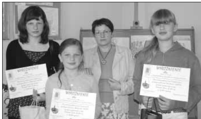
Na wystawie poplenerowej.