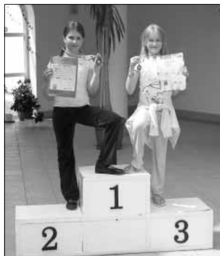
Medalistki zawodów pływackich.