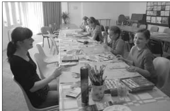
Podczas zajęć plastycznych w Sokołowie.