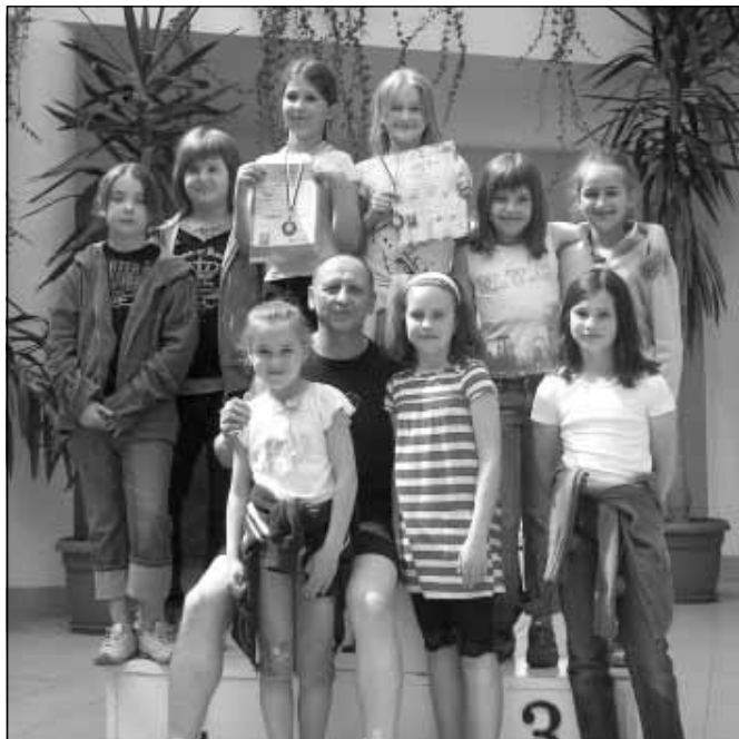
Pamiątkowe zdjęcie uczestników zawodów.

W dniu 30 kwietnia 2009 roku na pływalni krytej w Łańcutie rozegrano zawody w pływaniu. Wśród zaproszonych sekcji pływackich m.in. z Nowej Sarzyny, również sekcja pływacka