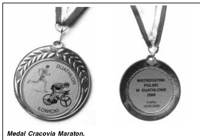
Medal Cracovia Maraton.