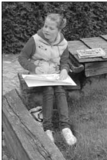
Młodzi artyści przy pracy.

Zabytkowy kościół i plebania w Koprzywnicy.