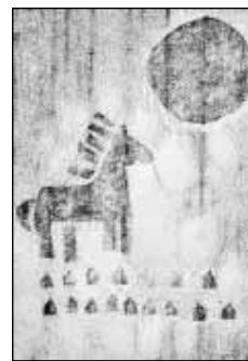
„Księżyc i koń” – Marta Nykiel.