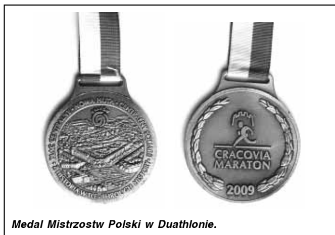
Medal Mistrzostw Polski w Duathlonie.