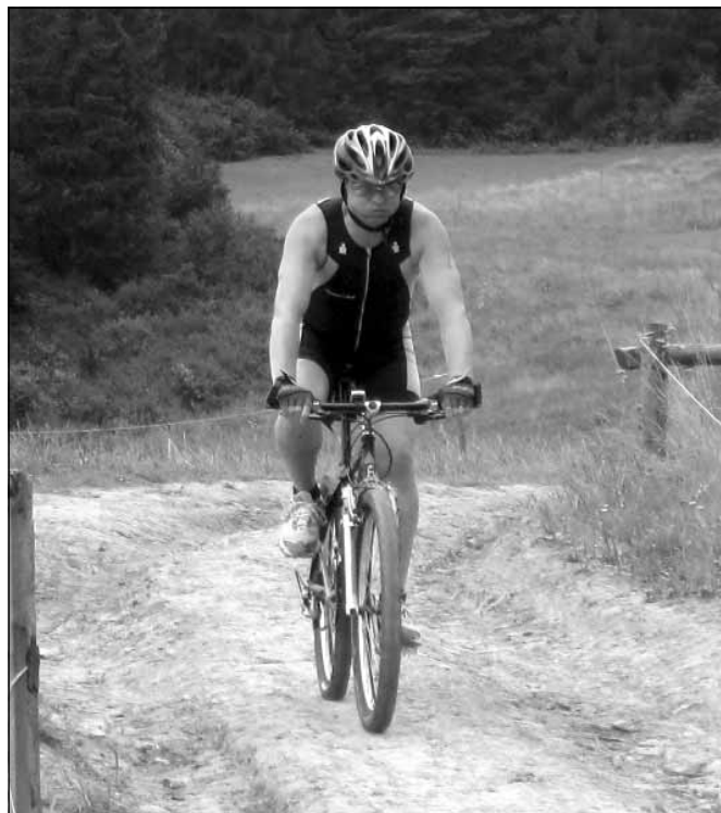
Na trasie zawodów – Cyklokarpaty, Iwonicz-Zdrój.

Po pierwszym boju rowerowym przyszedł czas na udział w dniu 18.07.2010 roku w Maratonie Rowerowym Cyklokarpaty w Iwoniczu Zdroju. Dystans 42 km o przewyższeniach 1326 m n.p.m. pokonałem w czasie 03:16:02 ze śr 12,85/km i był to dla