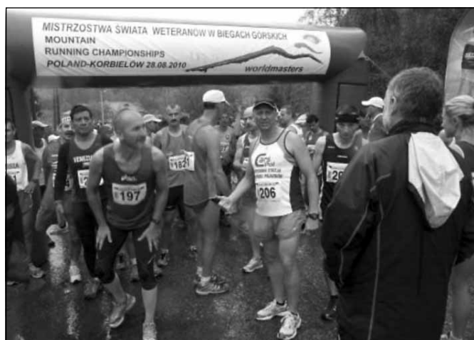
Na starcie Mistrzostw Świata.