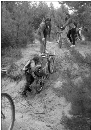
Przeprawa przez rów.

Aby uatrakcyjnić zajęcia świetlicowe dla dzieci i młodzieży w dniu 29.08.2010 r. zorganizowany został wyjazd rowerowy przez kompleksy leśne na Wysoką Głogowską do Domku Myśliwskiego. W wycieczce brało udział 15 uczestników wraz z opiekunami.