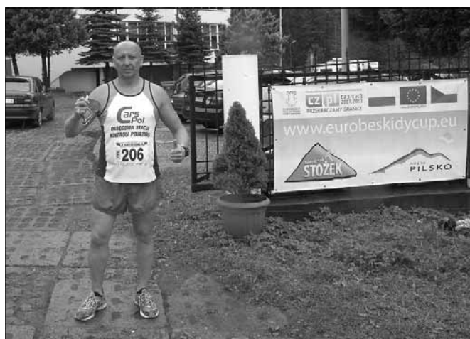
Z medalem po biegu Mistrzostw Świata.