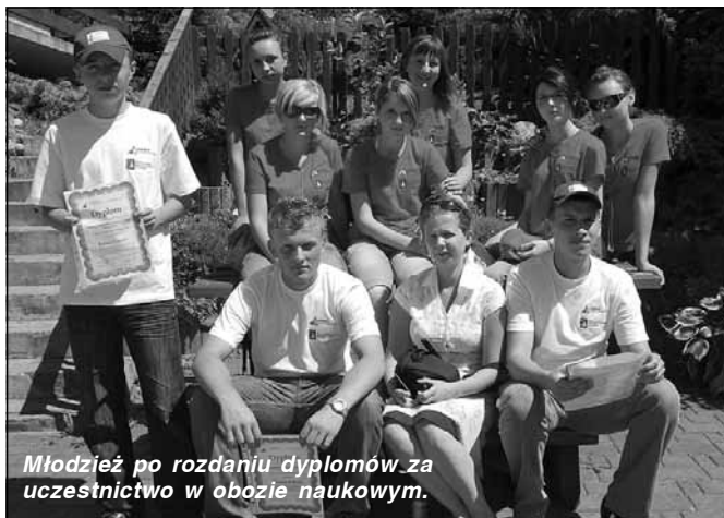
Młodzież po rozdaniu dyplomów za uczestnictwo w obozie naukowym.