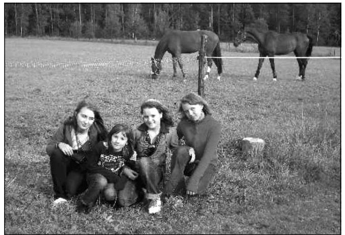
Zagroda dla koni.

Ostatnim punktem wycieczki było zwiedzanie stadniny koni w Wysokiej Głogowskiej znajdującej się niedaleko Domku Myśliwskiego.