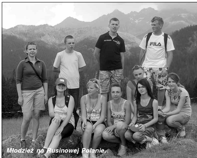
Młodzież na Rusinowej Polanie.

w ramach projektu Szkoła Kluczowych Kompetencji Program rozwijania umiejętności uczniów szkół Polski Wschodniej