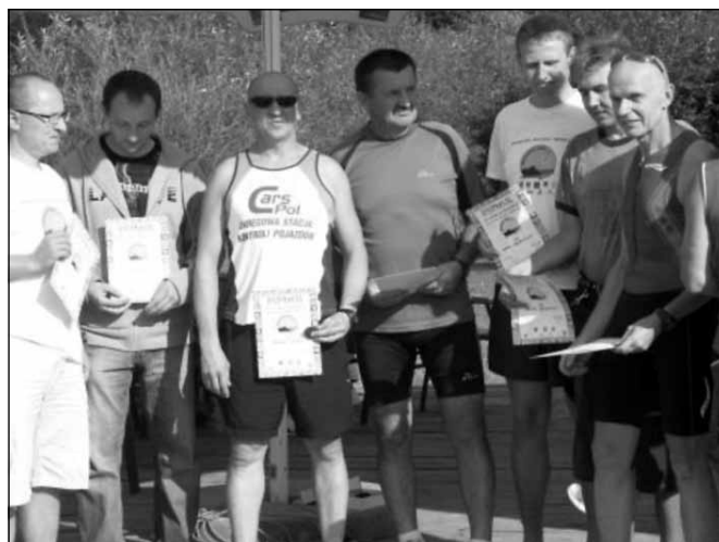
Zdjęcie z I Mistrzostw Polski w Cross Triathlonie.