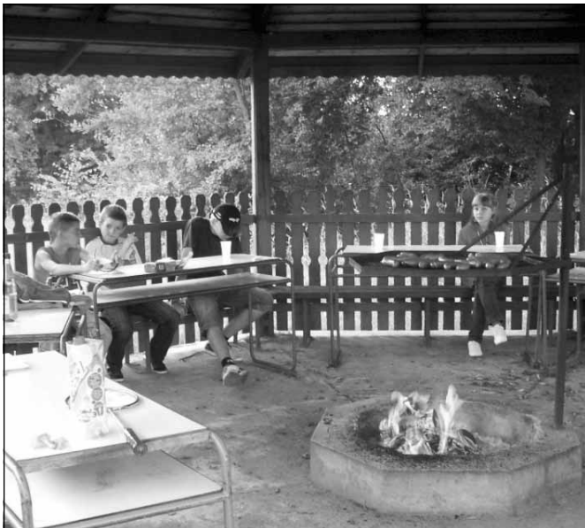
Poczęstunek w altance.

Po pokonaniu kilkukilometrowej trasy młodzież zgromadziła się w altance na chwilę odpoczynku gdzie czekał na nich rozpalony grill z kiełbaską.