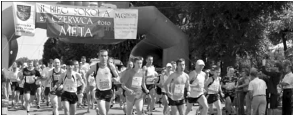
Start do biegu.